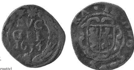
Gelderland, duit, 1634 (1½ x ware grootte)