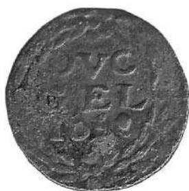
Gelderland, duit, 1635? (1½ x ware grootte)