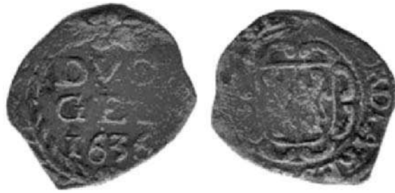
Tekstvariant op duit 1636 (1/2 ware grootte)

Wat is nu precies de reden geweest van deze tekstvarianten? De veronderstelling dat de tekst iets te maken zou kunnen hebben met de herovering van Roermond zou met de vondst van dit exemplaar op losse schroeven komen te staan. In 1636 was er echter een verovering die gevierd kon worden. In dat jaar was er 'Blytschap op de verovering van geweldich fort van 's-Gravenweert'. Deze plaats is vlakbij Kleef gelegen en behoorde lange tijd tot Nederland. In die tijd werd het 'Schenkenschans' genoemd en tegenwoordig behoort het bij Duitsland. 8 De schans was in 1586 door Maarten Schenk van Nydeggen aangelegd en werd gezien als de toegangspoort tot de Republiek. Op 27 juli 1635 was de schans door de Spanjaarden onder