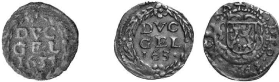
Links: duit 1634 (die ook voor 1631 wordt aangezien). Rechts: duit jaren dertig zonder eindcijfer (1½ x ware grootte)

len over het aanmunten van duiten. Om in geval van externe opdrachtgevers de kosten nauwkeurig te kunnen berekenen heeft de muntmeester mogelijk de duiten voorzien van een gewijzigde tekst. Door deze gewijzigde tekst kon hij de exemplaren onderscheiden van de andere. Dat er maar zeer weinig duiten zijn teruggevonden met de afwijkende tekst kan er op wijzen dat zij zijn uitgevoerd naar elders wat muntslag in opdracht van de VOC als optie ook zeer aannemelijk maakt.