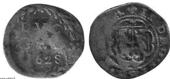
Gelderland, duit, 1628 (1½ x ware grootte)